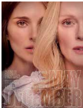
Secretos de un escándalo

20 anys després que el romanç entre Gracie Atherton-Yu i el seu jove marit Joe escandalitzés el país, es rodarà una pel·lícula sobre la seva història.